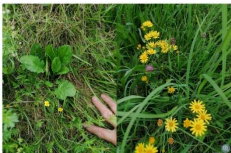
Grundblattrosette Wasser-Kreuzkraut (links) und Blüten im zweiten Lebensjahr (rechts) im mehrnützigen Bestand

(Quellen: https://de.wikipedia.org/wiki/Wasser-Greiskraut , https://stmk.lko.at/ )